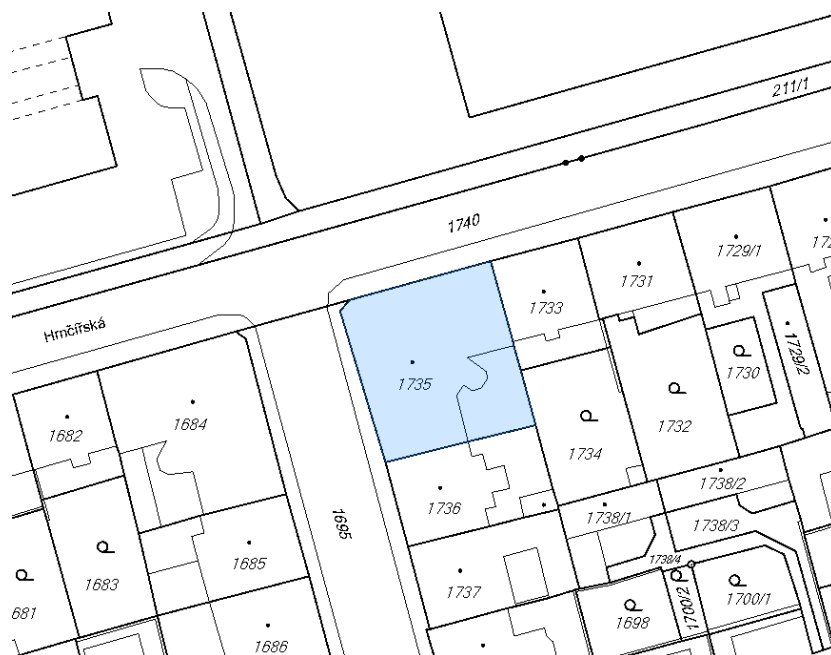
Obr. Situace objektu Hrnčířská 21 (katastrální mapa)